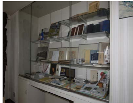
▲ 作家 小檜山博氏原稿等