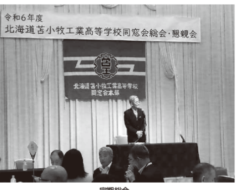
令和6年度 北海道苦小牧工業高等学校同窓会総会・懇親会 定期総会

令和6年度の定期総会が7月27日(土) グランドホテルニュー王子にて100名の出席のもと開催されました。令和2年は2月に新型コロナウイルス感染症が拡大したため、残念ではありましたが中止させていただきました。令和3・4年につきましても新規感染者が高止まり傾向にあり、また、予定していた会場がワクチン接種会場に指定されるなどにより中止いたしました。令和5年度については、10月の記念祝賀会が控えていたため会員皆様の出費を考慮中止しました。今年度の総会は5年振りの開催となりました。